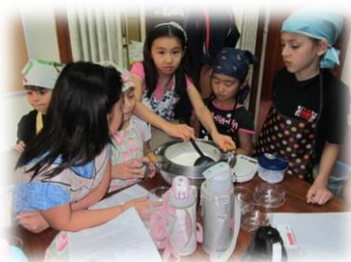
パンナコッタ作り