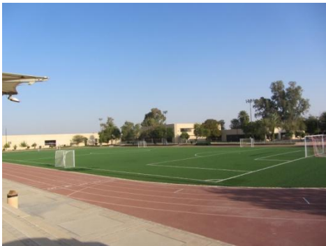
会場となったキングファイサルスクール競技場

この行事を通して、真正面から自分の力と向き合い、持っている力を出し切る経験を積み重ねることで、「頑張る心」「あきらめない心」を育むことができました。